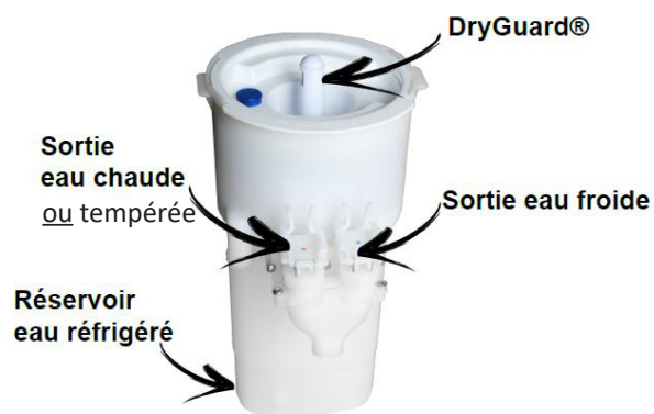
KIT D'HYGIÈNE Réservoir + sortie de distribution

Garantis 1 an pièces, 2 ans groupe froid.